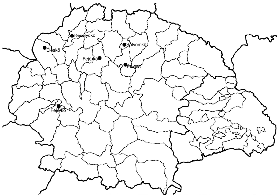
4. térkép. Az 1350–1399 között adatolható kő utótagú várnevek